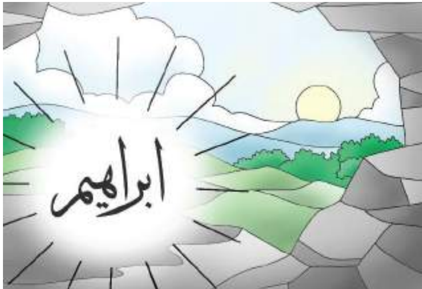
Gambar 10.5 Nabi Ibrahim kecil sedang mencari Tuhannya.

Nabi Ibrahim a.s. akhirnya menemukan Allah Swt. sebagai Tuhan Yang Maha Esa dan Maha Menciptakan.