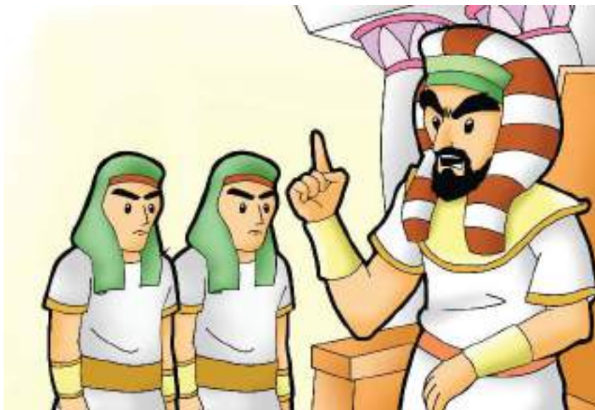
Gambar 10.4 Raja Namrud adalah raja yang zalim dan kejam.

Ia khawatir bila nanti dewasa akan mengalahkannya.