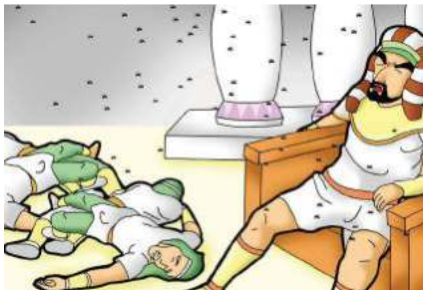
Gambar 10.7 Raja Namrud dan pasukannya binasa karena azab Allah Swt.

Namun, mereka menentang bahkan menganggapnya gila. Sampai suatu ketika, Nabi Ibrahim a.s. menghancurkan semua berhala, kecuali berhala yang paling besar. Raja Namrud marah dan memberi hukuman Nabi Ibrahim a.s. dengan cara dibakar. Allah Swt. selamatkan Nabi Ibrahim a.s. dari kobaran api. Sebaliknya, Allah Swt. kirimkan jutaan nyamuk sebagai azab bagi Namrud dan pasukannya.