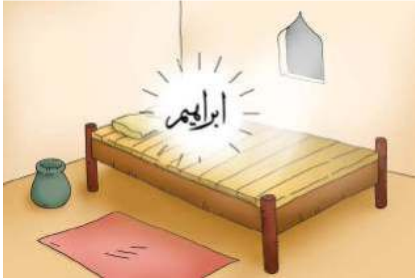
Gambar 10.8 Nabi Ibrahim mimpi menyembelih putranya, Ismail.

Akhirnya, dengan rela berkorban Nabi Ibrahim a.s. melaksanakan perintah Allah Swt.