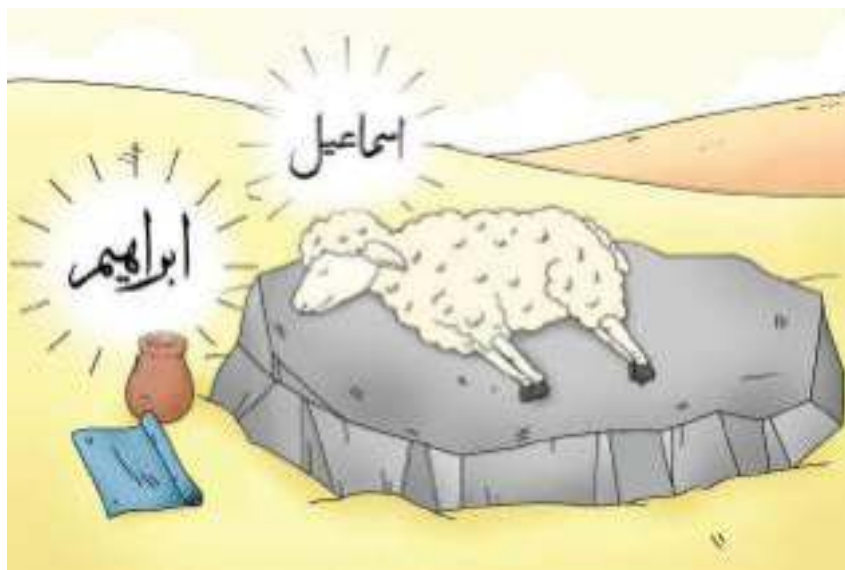
Gambar 10.9 Nabi Ibrahim a.s. hendak menyembelih domba.

Begitu hendak menyembelih putranya, Allah Swt. menggantinya dengan domba jantan dari surga.