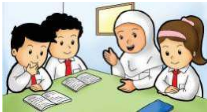
Gambar 10.10 Arai dan teman-temannya saling menghargai dalam diskusi kelompok.

Contohnya salat lima waktu, rajin belajar, hormat kepada orang tua dan guru, serta menyayangi sesama.