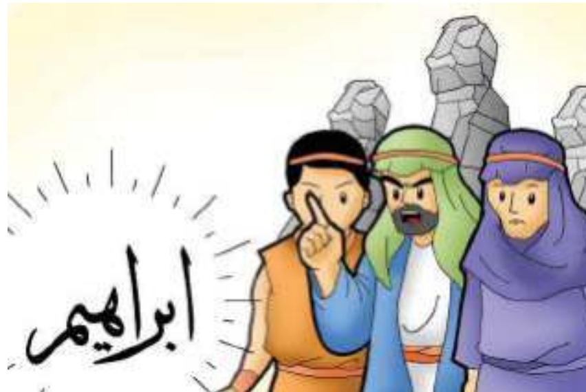
Gambar 10.6 Nabi Ibrahim a.s. berdakwah kepada kaumnya.

Nabi Ibrahim a.s. mengajak ayahnya dan masyarakat agar menyembah Allah Swt.