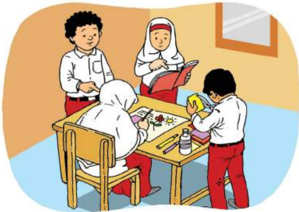
Gambar 7.1 Peserta didik kelas 4 sedang berdiskusi kelompok