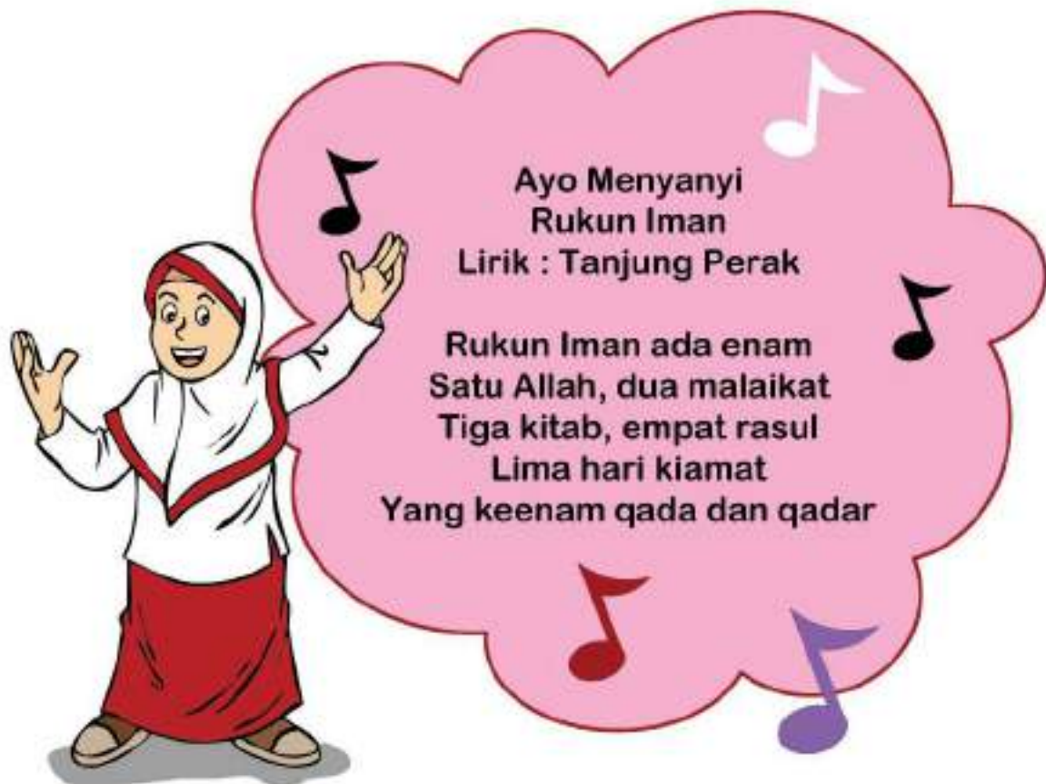
Gambar 7.2. Menyanyi Rukun Iman

Pertanyaan ini pernah diajukan sahabat kepada Rasulullah saw. Pada suatu hari, Rasulullah saw. berkumpul dengan para sahabatnya. Seketika seorang laki-laki hadir dan bertanya, “Ya Rasulallah, apakah iman itu?” Rasul menjawab, “Iman itu kamu percaya kepada Allah, malaikat, kitab-kitab yang diturunkan Allah, rasul-rasul yang diutus-Nya, hari kemudian dan takdir-Nya yang baik dan yang buruk.