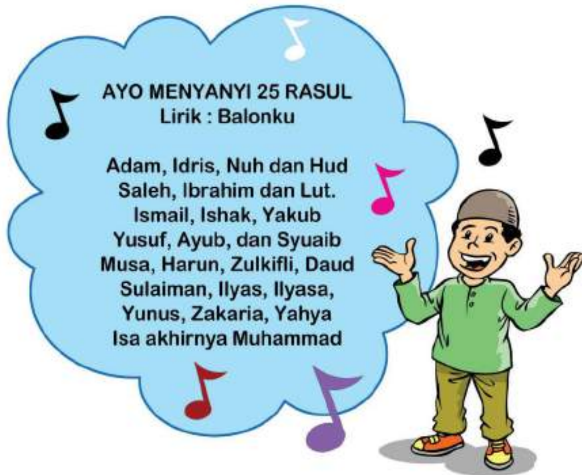
Gambar 7.3 Menyanyi Rukun Iman

Rasul yang wajib diimani ada 25. Nama-nama rasul ini diceritakan dalam Al-Qur’an. Siapa sajakah mereka?