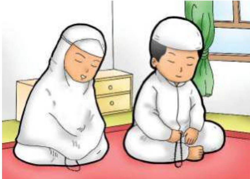
Gambar. 9.2 Imas dan Arai sedang berzikir setekah salat.