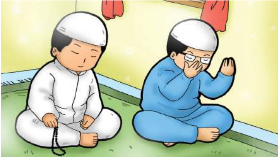
Gambar 9.1 Arai dan Gusti sedang berzikir dan berdoa setelah salat.

Apa yang dilakukan Arai dan Gusti pada gambar tersebut?