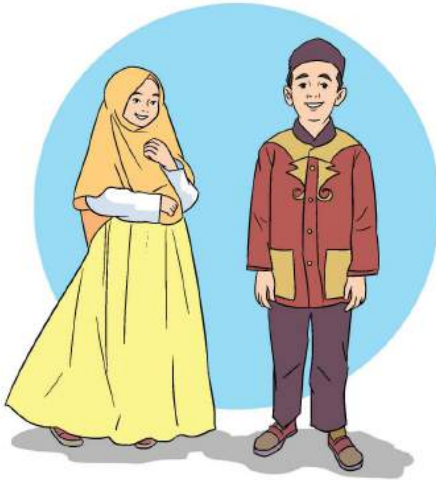
Gambar 4.7 Anak Muslim menutup aurat

Apakah kalian tahu yang dinamakan aurat? Apakah kalian juga tahu batas aurat laki-laki dan perempuan?