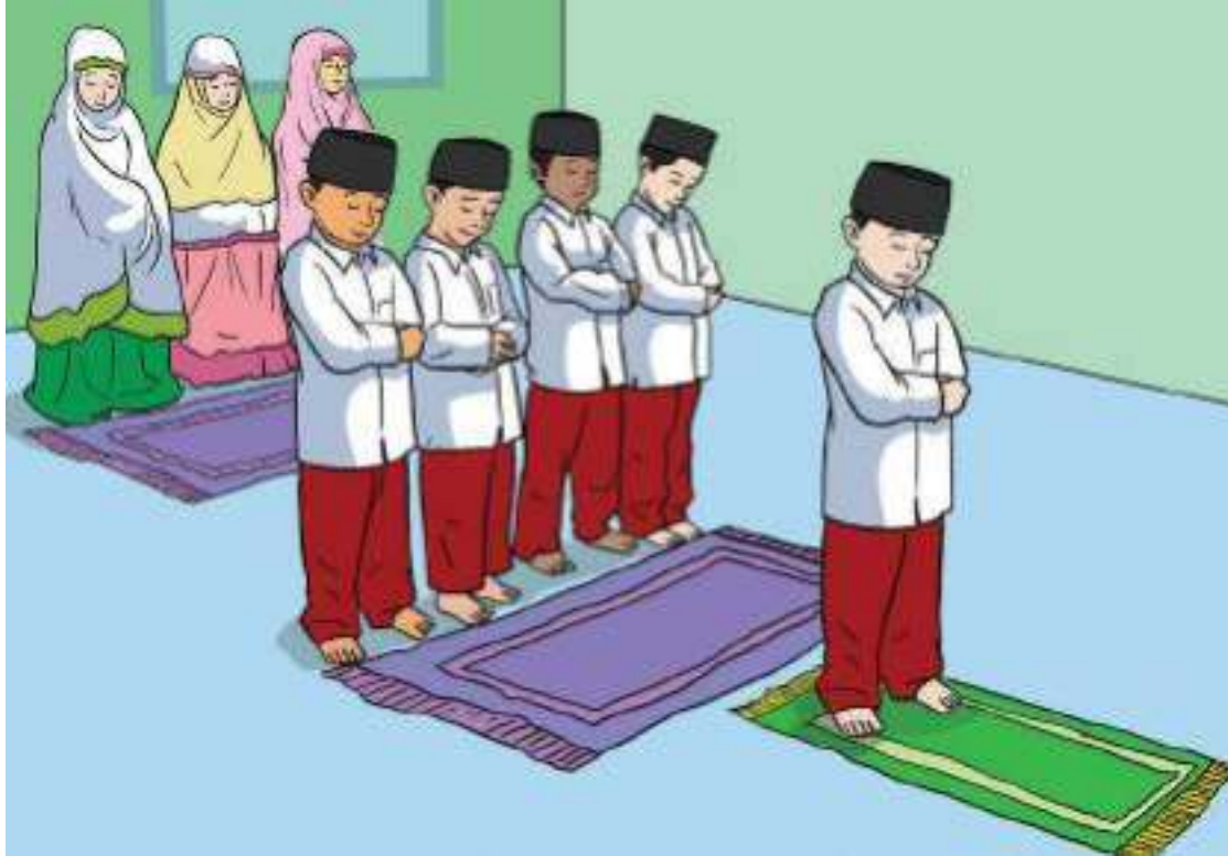
Gambar 4.6 Anak Muslim wajib salat

Sejak umur berapa kalian melaksanakan salat fardu lima waktu? siapa yang mengajari kalian doa dan tatacara salat? Mengapa kalian salat?