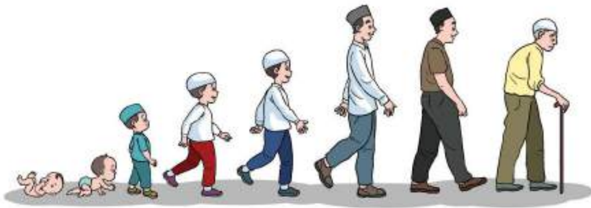
Gambar 4.2 Perkembangan manusia

Setelah mengamati gambar di atas, apa kesimpulan kalian terhadap gambar tersebut? Ayo kemukakan kepada teman-temanmu!