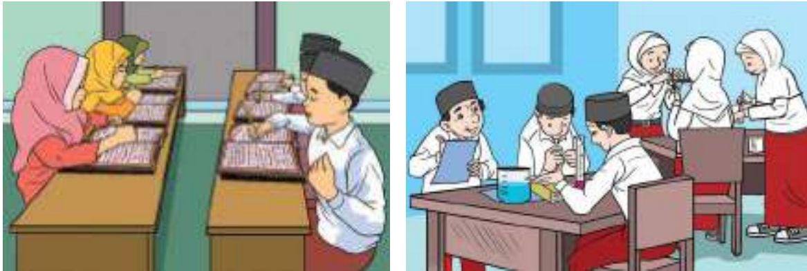
Gambar 4.8 Tekun belajar

Mata pelajaran apa yang paling kalian sukai? Mengapa kalian menyukai pelajaran itu?