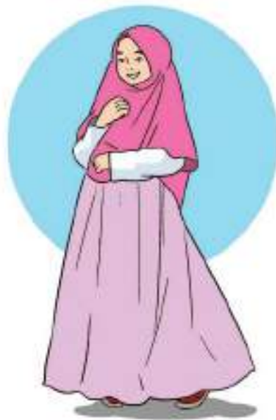
Gambar 4.5 Perempuan remaja