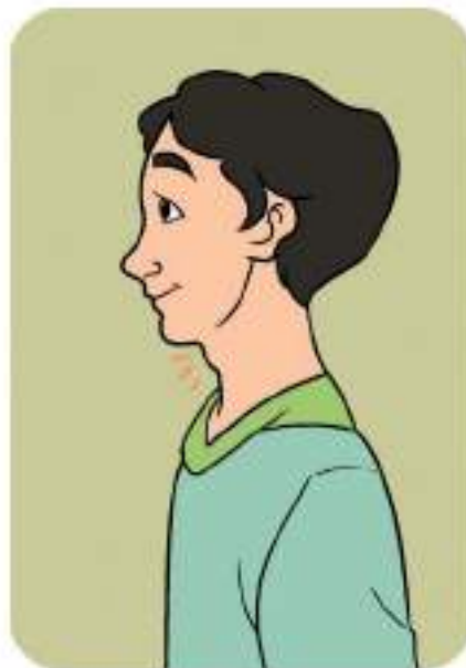
Gambar 4.4 Laki-laki remaja

Tahukah kalian tanda-tanda anak laki-laki yang masuk masa puber? Ayo kita mempelajarinya!