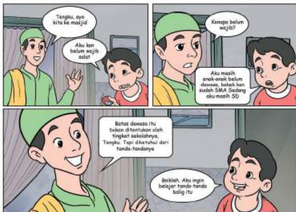
Gambar 4.3 Belajar tanda-tanda balig

Apakah kalian telah mengetahui tanda-tanda balig menurut fikih? Apakah ada perbedaan antara anak laki-laki dan perempuan?