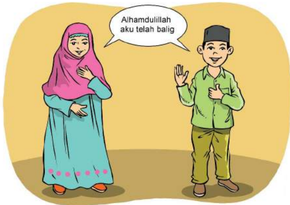
Gambar 4.1 Bahagia telah dewasa