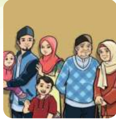
Gambar 9.4 Bersama dengan keluarga besar