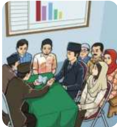
Gambar 9.2 Akad nikah