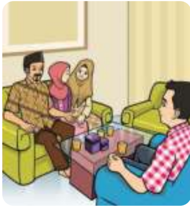
Gambar 9.1 Ta'aruf dengan keluarga calon istri