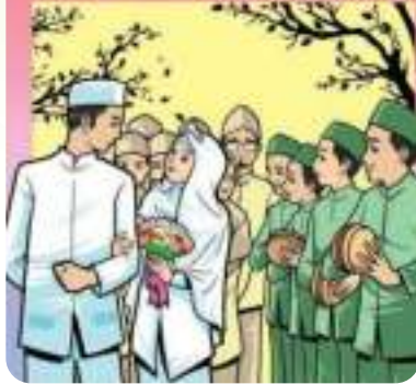
Gambar 9.3 Resepsi pernikahan