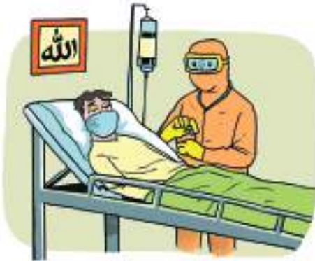
Gambar 1.2 Sabar dan tabah

Amati gambar dibawah ini, kemudian jelaskan makna yang tersirat dalam gambar tersebut!