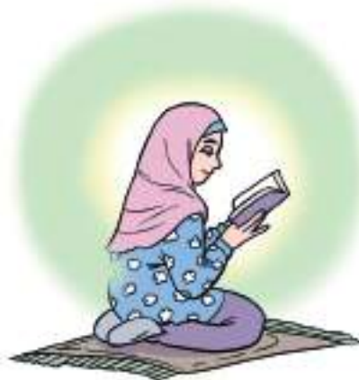
Gambar 1.5 Tekun beribadah