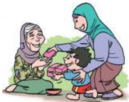
Gambar 1.6. Peduli kepada orang miskin