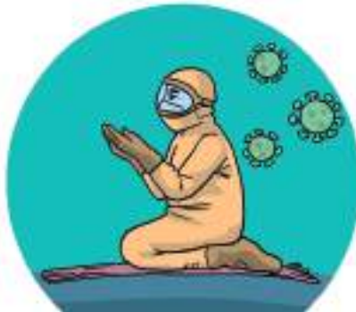
Gambar 1.4 Sabar dan berdoa