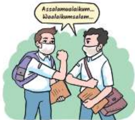
Gambar 1.3. Berdoa dan ikhtiar